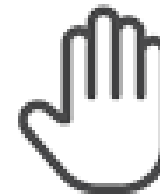
Evitar tocarse la cara.