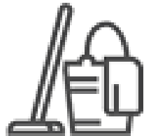
Limpiar y desinfectar superficies y objetos de uso frecuente.