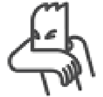
Toser o estornudar en el pliegue del codo.