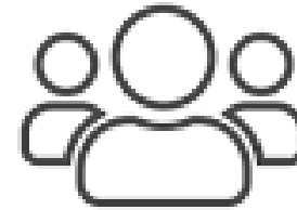
Tener especial cuidado con grupos de riesgo.