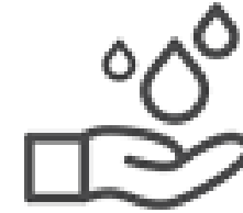
Lavarse las manos con agua y jabón o utilizar alcohol en gel.